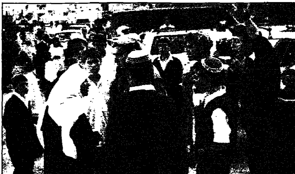
مستوطنون يمتنعون أمام قوات فلسطينية من التوصل لاتفاق بعد مواجهات في مدينة الخليل (رويترز)